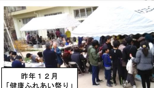
昨年12月 「健康ふれあい祭り」 の様子

昨年末の「健康ふれあい祭り」は、安全衛生を留意し恒例の餅つき大会をやめ、健康測定会、みたらし団子・おでん等の模擬店、バザーの併催等とこれまでとは少々趣を変えましたが、200名を超える多くの皆様に来ていただきました。ボランティアの方々をはじめ、鳴海の中央発条労働組合の皆さん、各市大の先生・学生さんにもご協力をいただき、盛況裡に終了することが出来ました。誠にありがとうございました。