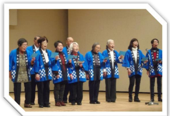
演芸大会 天白小劇場にて

昨年12月から講座・同好会の幹事会を二度実施し、1月26日（金）には実行委員にお集まりいただき綿密な打ち合わせを行いました。15人の実行委員の方は、司会者、音響（機器操作）、舞台（セット等）の設営、受付など多岐にわたり活躍！みなさまのお蔭で無事に閉幕しました。ありがとうございました。