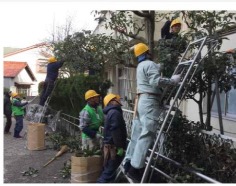
樹木剪定技術会場 天白福社会館にて

名古屋市シルバー人材センターの樹木選定技術の研修会場として、今年も天白福社会館の庭園が選ばれ、2月7日(火)9時～16時まで指導者、係員と実習者合わせて20名の方が参加し、庭園内の木々の剪定を行いました。恒例の身体ほぐしの体操の後、お手本の技術を学習しながら、庭園内の種々の木々を剪定しました。おかげで木々が形を整え、春を迎える準備が出来ました。