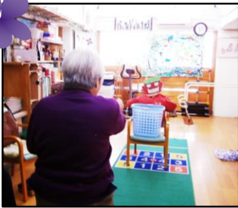
節分豆まきゲーム